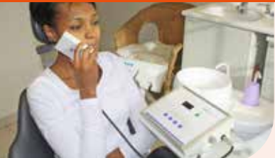
Die Magnetfeldtherapie führt auch in der ganzheitlichen Kieferorthopädie zu Erfolgen.