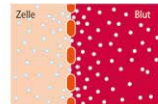
Die Magnetfeldtherapie erweitert die Blutbahn. Der Sauerstoff kann fließen und der so angeregte Stoffwechsel fördert die Giftausleitung, bzw. beschleunigt Heilungsprozesse.