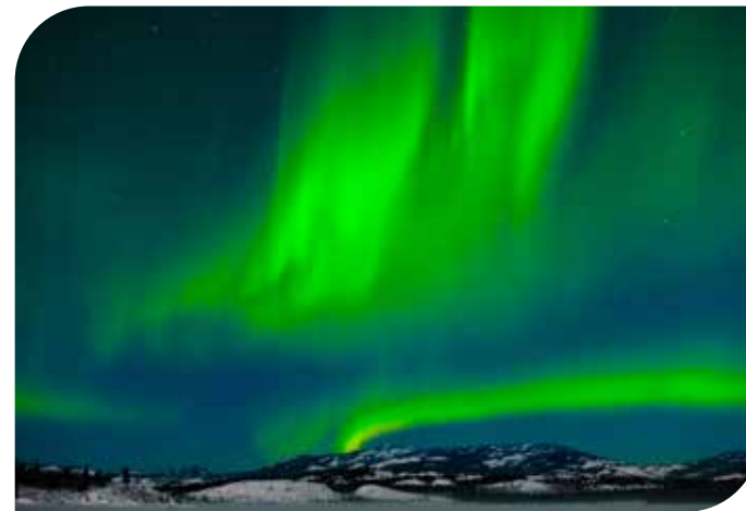
Die Stärke und das Vorhandensein des Magnetfeldes, das unseren Körper beeinflusst, wird in den nördlichen und südlichen Bereichen der Erde in Form von sog. Nordlichter sichtbar.

Auch im Bereich der Gelenkrankheiten gibt es Erfolge. Hier kann bereits verschlissene Knorpelmasse regeneriert werden, so daß die Schmerzen bei der Bewegung verschwinden.